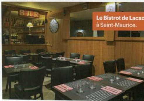
Le Bistrot de Lacaze à Saint-Maurice.