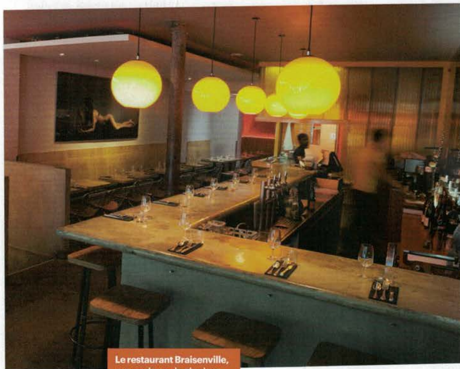
Le restaurant Braisenville, aux couleurs du charbon brut et incandescent.